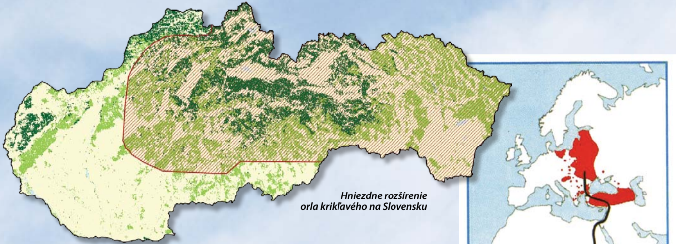
Hniezdne rozšírenie orla krikľavého na Slovensku