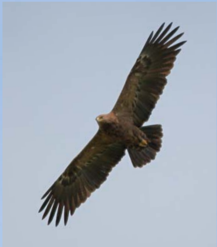
Letiaceho orla krikľavého spoznáme podľa typických širokých doskovitých krídel.