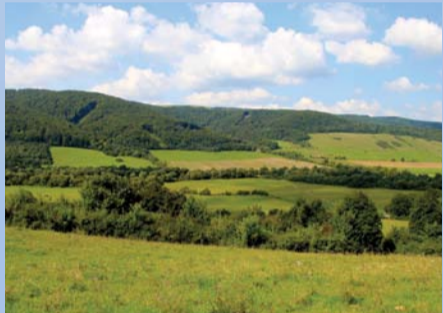
Hniezdny a potravný biotop orla krikľavého v Laboreckej vrchovine.

Najväčší podiel na stratách v období hniezdenia má nevhodná lesohospodárska činnosť, ktorá spôsobuje nielen vyrušovanie, ale aj poškodenie a celkové znehodnotenie hniezdných biotopov. K celkovým stratám prispievajú aj iné faktory, napríklad nedostatok potravy v nevhodne obhospodarovanej poľnohospodárskej krajine, či zranenia alebo usmrtienia počas migrácie.